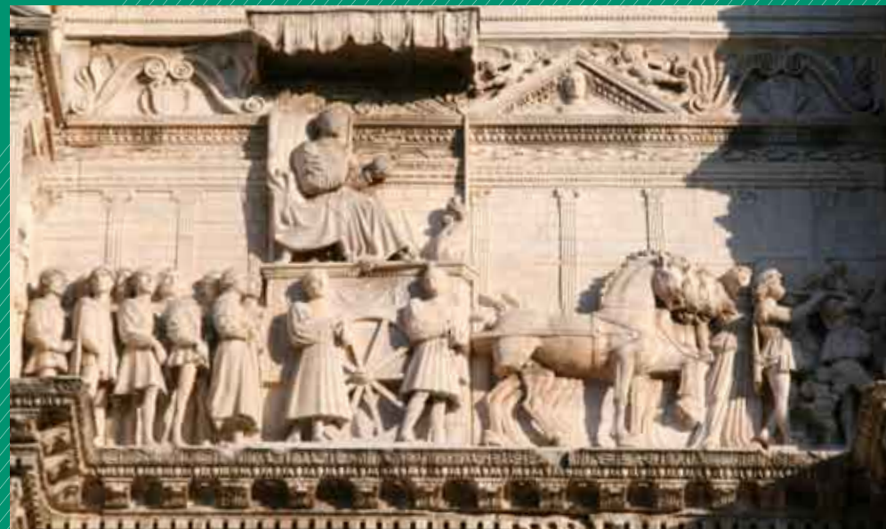
TRIOMFBOOG CASTELNUOVO: INTOCHT ALFONSO IN NAPELS IN 1443

Zie verder: www.rug.nl/alumni > Activiteiten & Nieuws.